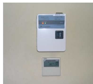
▲みんなの部屋以外の操作パネル (コイン投入機は使用しません)