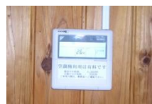
▲みんなの部屋の 操作パネル